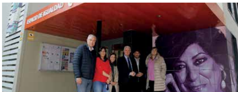
▲ Las autoridades locales y los familiares de la escritora, el día de la inauguración.

Dentro del amplio programa de actividades para conmemorar el 8 de marzo, Día Internacional de la Mujer, el Ayuntamiento honró la memoria de la gran escritora Almudena Grandes. La inauguración oficial del mural de la autora, que ya da nombre al Espacio de Igualdad, contó con la presencia de las autoridades locales, allegados, familiares y el hermano de Almudena Grandes.