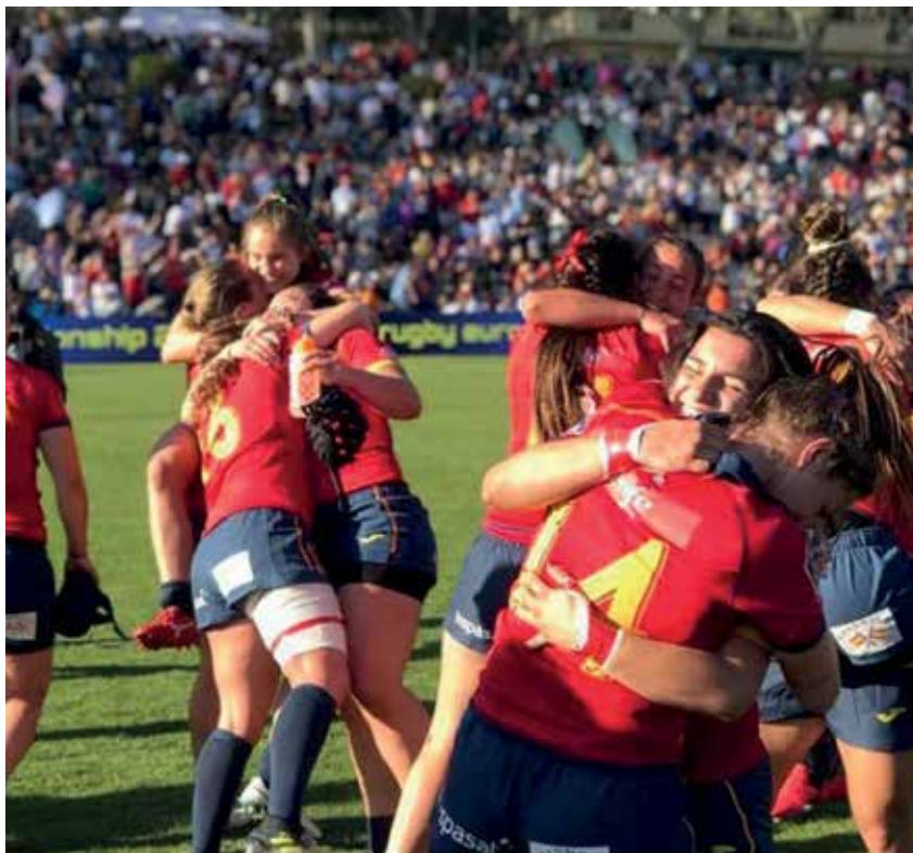
▲ Sobre estas líneas, 'las leonas' celebrando el triunfo. La jugadora de Sanse ha sido un bastión para el equipo.

Su objetivo inicial fue retomar la escuela municipal que Sanse tuvo durante los años 80. Más de 20 años después de su desaparición, algunos de los que formaron parte de ella deseaban ofrecer a niños y niñas la posibilidad de conocer un deporte diferente, que siempre se ha sitinguido por sus valores de solidaridad colectiva y su espíritu de equipo. ■