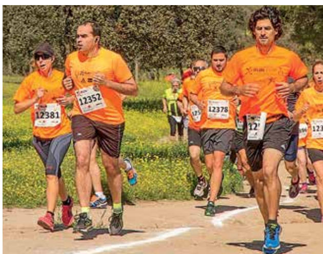
▲ Esta carrera con un fin solidario ha tenido gran acogida en nuestra ciudad.

El objetivo de este evento social y deportivo es sensibilizar a la población sobre esta enfermedad neurodegenerativa. Esta edición ofrece un atractivo recorrido por la Dehesa Boyal y el Polideportivo municipal. Se trata de un cross de 7 km. para mayores de 12 años, una carrera cronometrada con chip desechable en colaboración con la Federación de Atletismo de Madrid.