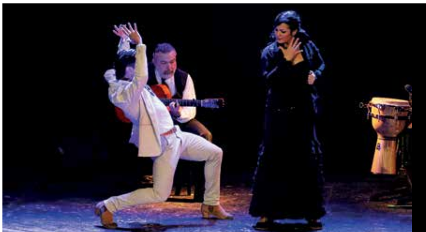
▲ 'Lorca es flamenco' recorre este arte tradicional, el mundo taurino y los Cafés Cantantes.

Este "drama de las mujeres de los pueblos de España", como tituló su autor, llega bajo la dirección de José Carlos Plaza con un reparto formado por ocho actrices con solera como Ana Fernández, Ruth Gabriel,