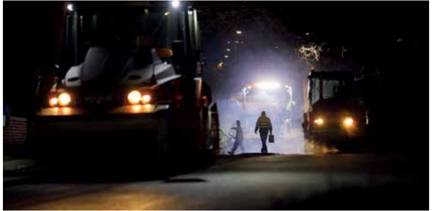
▲ Durante esta segunda fase, se ha trabajado día y noche para cumplir unos plazos que han finalizado antes de los plazos estipulados.