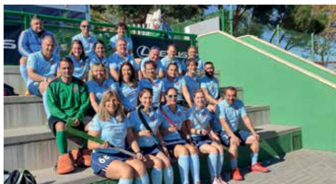
▲ Los Papis y Mamis del hockey hierba lo han dado todo esta temporada.

Ambos éxitos reeditan los ya conseguidos en anteriores temporadas. Asimismo, en esta temporada han alcanzado la victoria en el Torneo Internacional de Roma y en los torneos de San Fernando y Getxo en sus categorías. ■