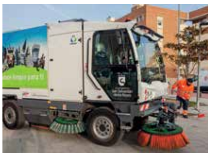
▲ Habrá más medios materiales y humanos para la limpieza.

El nuevo contrato de Limpieza, además de mejorar y ampliar el servicio e implementar la zona de Moscatelares, tiene la voluntad de aumentar medios con la inclusión de puntos limpios de proximidad que se instalarán en barrios y urbanizaciones, la