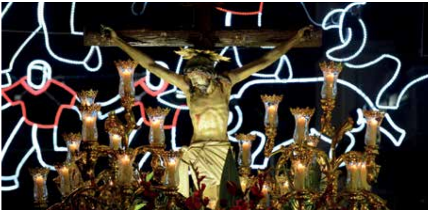
▲ Procesión nocturna del Cristo durante las Fiestas del año pasado.

El Ayuntamiento, a través de la Concejalía de Festejos, ha convocado el concurso para el cartel de las Fiestas en Honor al Santísimo Cristo de los Remedios de 2022, que se celebrarán a finales del mes de agosto. El tema del cartel ha de estar relacionado con las fiestas populares en Honor al Stmo. Cristo de los Remedios 2022. Se pueden presentar hasta dos obras por autor, originales e inéditas.