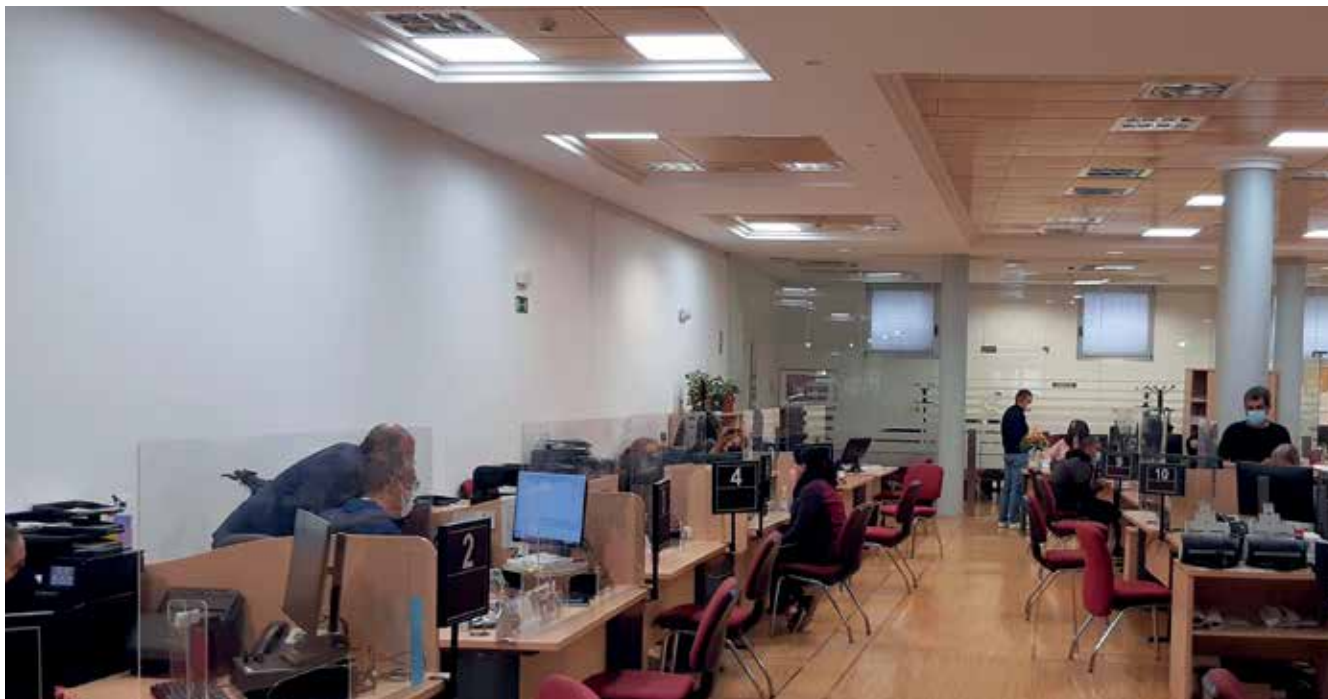
▲ Las oficinas del SAC están atendiendo y resolviendo de forma eficiente las demandas de los ciudadanos.