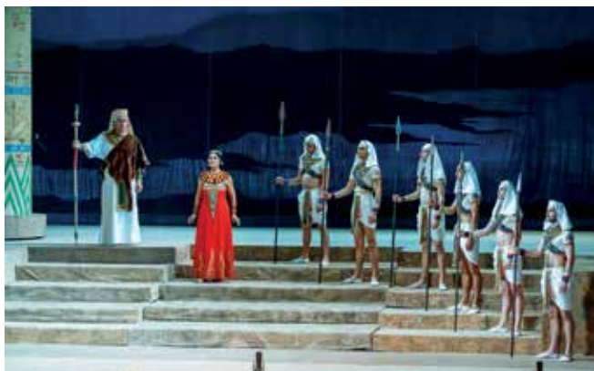
▲ La ópera 'Aida', el sábado 19, a las 20 h. en el TAM.