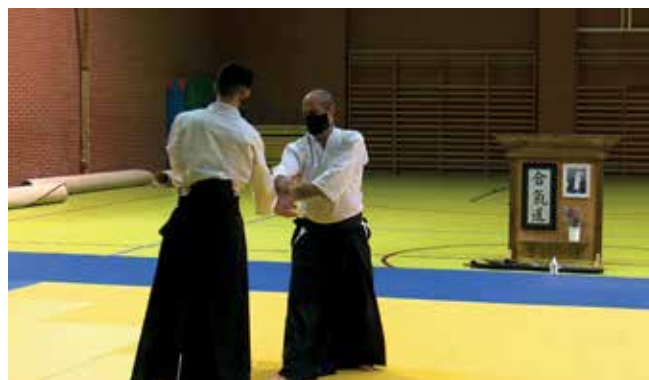
▲ Este arte marcial aúna elegancia y efectividad.