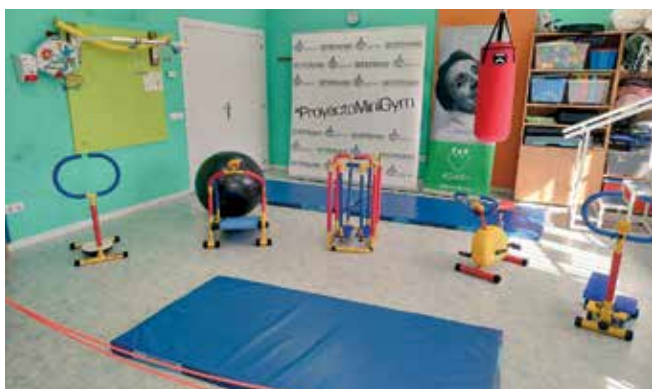
▲ Vista del espacio para realizar actividades físicas en el Centro de Atención Temprana de APADIS.

Este MiniGym es un pequeño gimnasio donado por la asociación El Poder del Chándal y por NutriSport SA para los niños de atención temprana. De esta forma, APADIS ya cuenta con un pequeño gimnasio en su Centro de Atención Temprana. ■