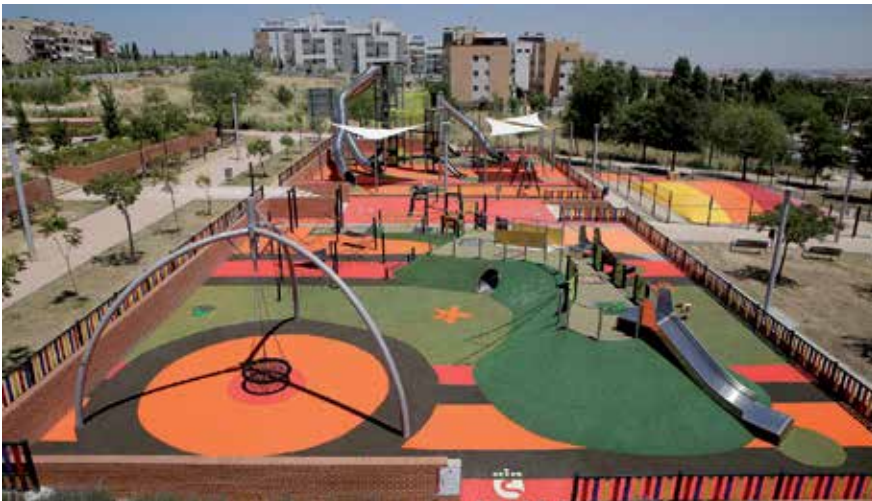
▲ En este mandato se han abierto dos grandes parques inclusivos, como el del barrio de Tempranales.

al mantenimiento de una superficie de 3.665.637,56 m 2 de zonas verdes entre las que se incluyen 1.050.905 de zonas forestales de ámbito urbano, la limpieza y conservación de 166 áreas infantiles, la red de infraestructura municipal de riego y los equipamientos de zonas verdes. También se dotará de más personal y más medios técnicos para garantizar una óptima gestión de dichas zonas verdes y sus instalaciones.