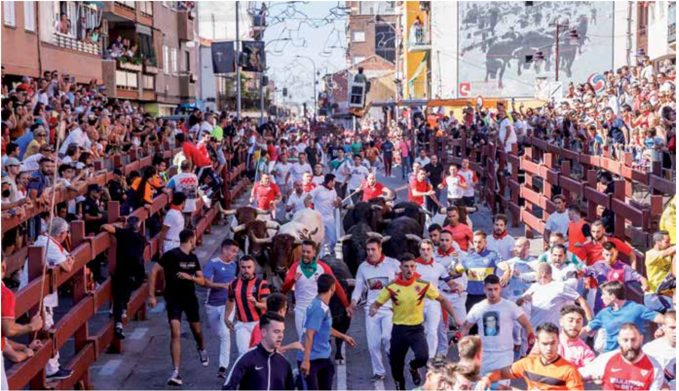
▲ Después del triste recuerdo de la inexplicable prohibición de los encierros 202, nos quedamos con el buen sabor de boca de unas fiestas 2022 históricas.

sentir, las tradiciones, la cultura, los conciertos, la procesión, el movimiento en las calles a finales de agosto.