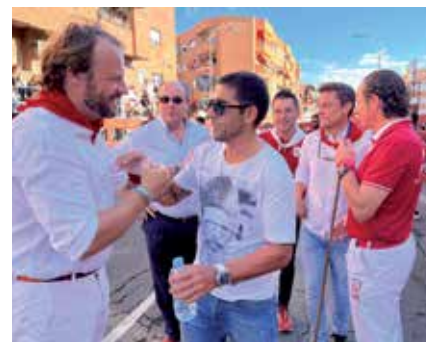
▲ Las fiestas han conseguido una gran repercusión a nivel nacional e internacional.