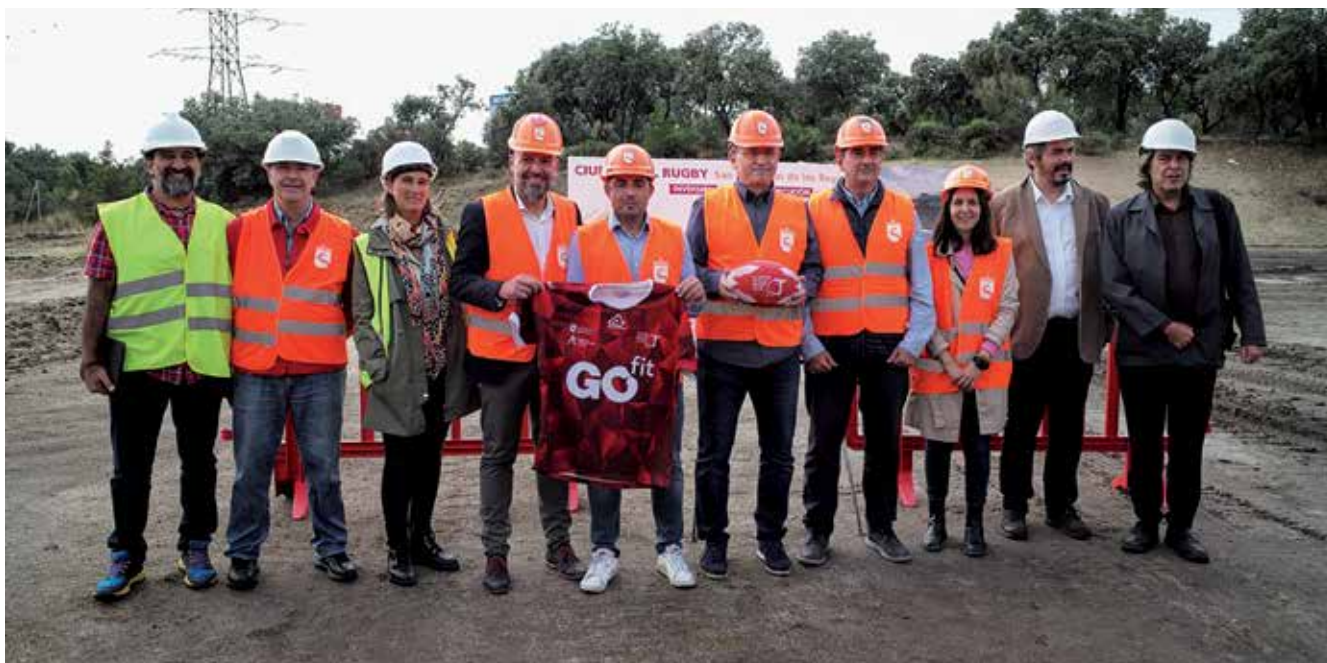
▲ En este mandato se ha iniciado la construcción de la Ciudad del Rugby.