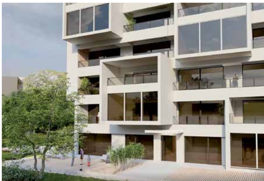
▲ El Ayuntamiento triplica la oferta de vivienda de gestión municipal, hasta 1.058, para el desarrollo urbanístico de Cerro del Baile.

El documento aprobado facilitará "la identificación mediante la elaboración de un estudio que fije la cuantía de la demanda y sus características pormenorizadas en cuanto a tipologías -familiares