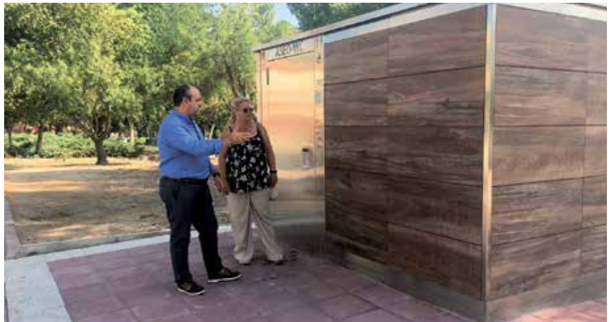
▲ Se han instalado 4 aseos públicos en distintos puntos de la ciudad.

Para resolver el contrato de parques actual, durante estos años la Concejalía de Parques y Jardines ha trabajado en el nuevo pliego, ahora está en licitación, y que supone una dotación de 77 millones de euros, con una duración de nueve años. Este gran avance en la prestación de servicios responderá de manera óptima al