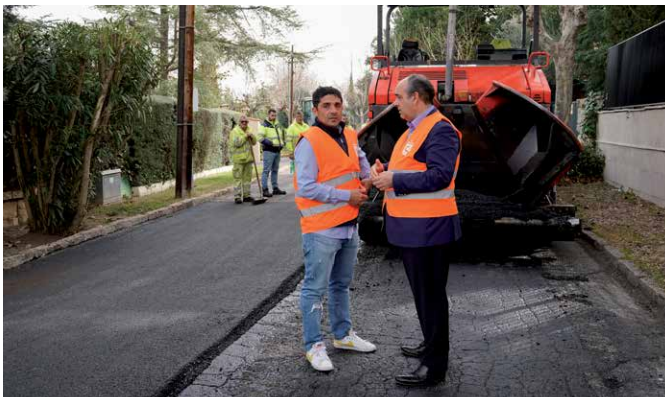
▲ Momento del inicio de la 3ª Fase de asfaltado en Fuente del Fresno.

También se ha logrado realizar la remodelación integral de la Escuela Infantil Las Cumbres, muy deteriorada tras 30 años de servicio, mejoras en la climatización de la Escuela Infantil La Locomotora, la actualización de numerosas pistas deportivas de los centros y multitud de reformas muy necesarias para la comunidad educativa.