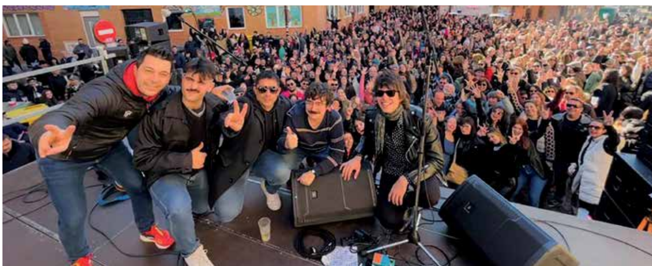
▲ La Tardebuena en nuestra ciudad tuvo una muy buena acogida, con la actuación de grupos musicales para todos los gustos.

Tras la pandemia y la suspensión, quisimos recuperar todo lo que dejamos de