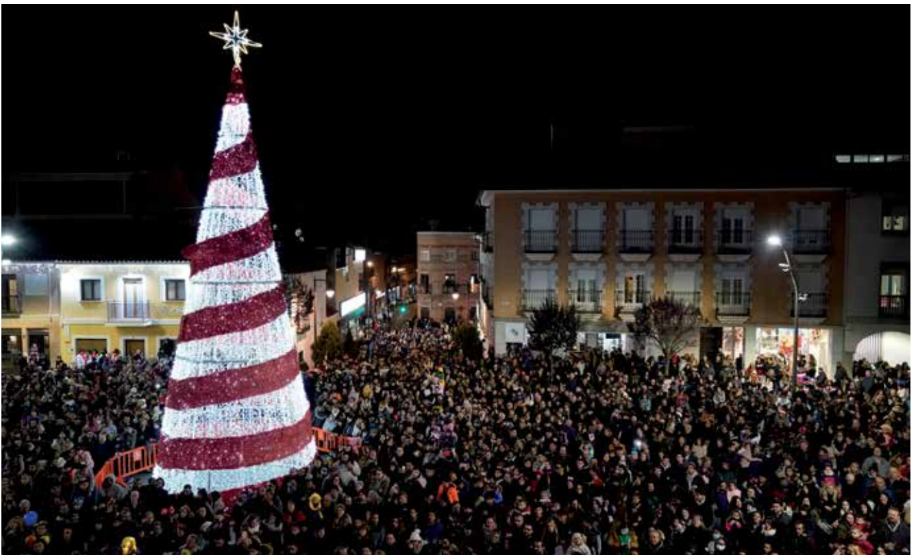
▲ Esta vista indica la multitudinaria participación vecinal en las últimas celebraciones navideñas.

En este mandato se ha abierto la sala dedicada a la tauromaquia, dentro del Museo Etnográfico, bajo el nombre del torero José Ortega Cano, muy vinculado a la ciudad. ■