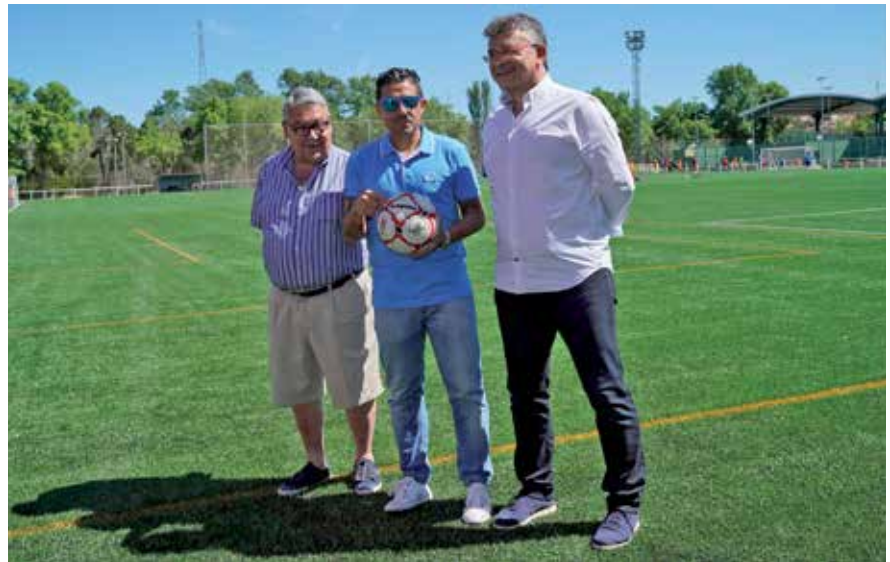
▲ Los cambios de césped natural y artificial han supuesto una inversión de 2,2 millones de euros.