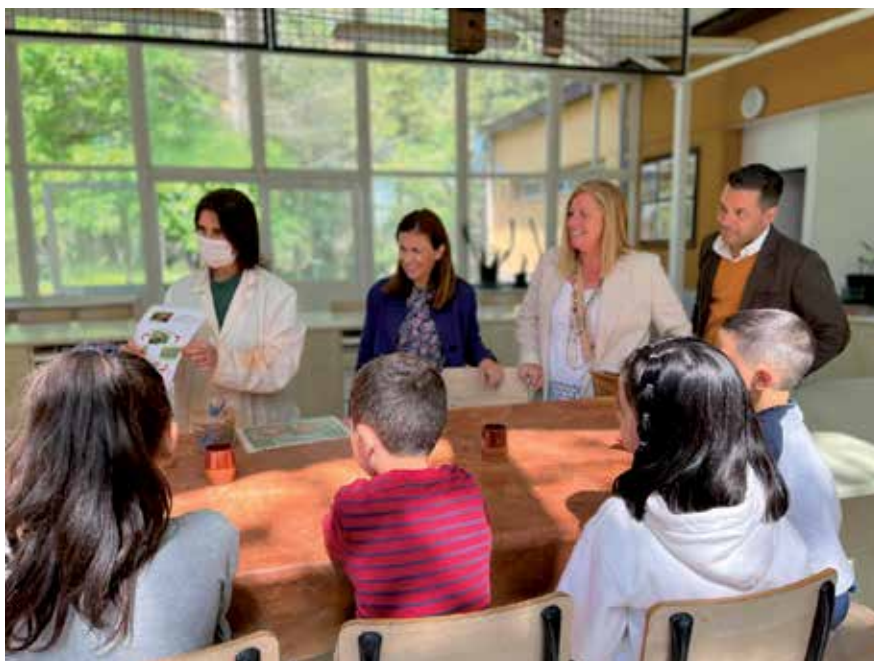
▲ En materia de medioambiente, las acciones se han dirigido a hacer accesible el Aula de Naturaleza.

Este nuevo pliego destina casi el doble de recursos económicos que el actual y mejora sensiblemente la prestación de servicios a la ciudad. Se ha licitado por más de 82,1 millones de euros para un período de ocho años, lo que supone un incremento del 47,3 por ciento por encima del precio del presente contrato. Durante este mandato, y con las mermas del contrato, desde la Concejalía se han