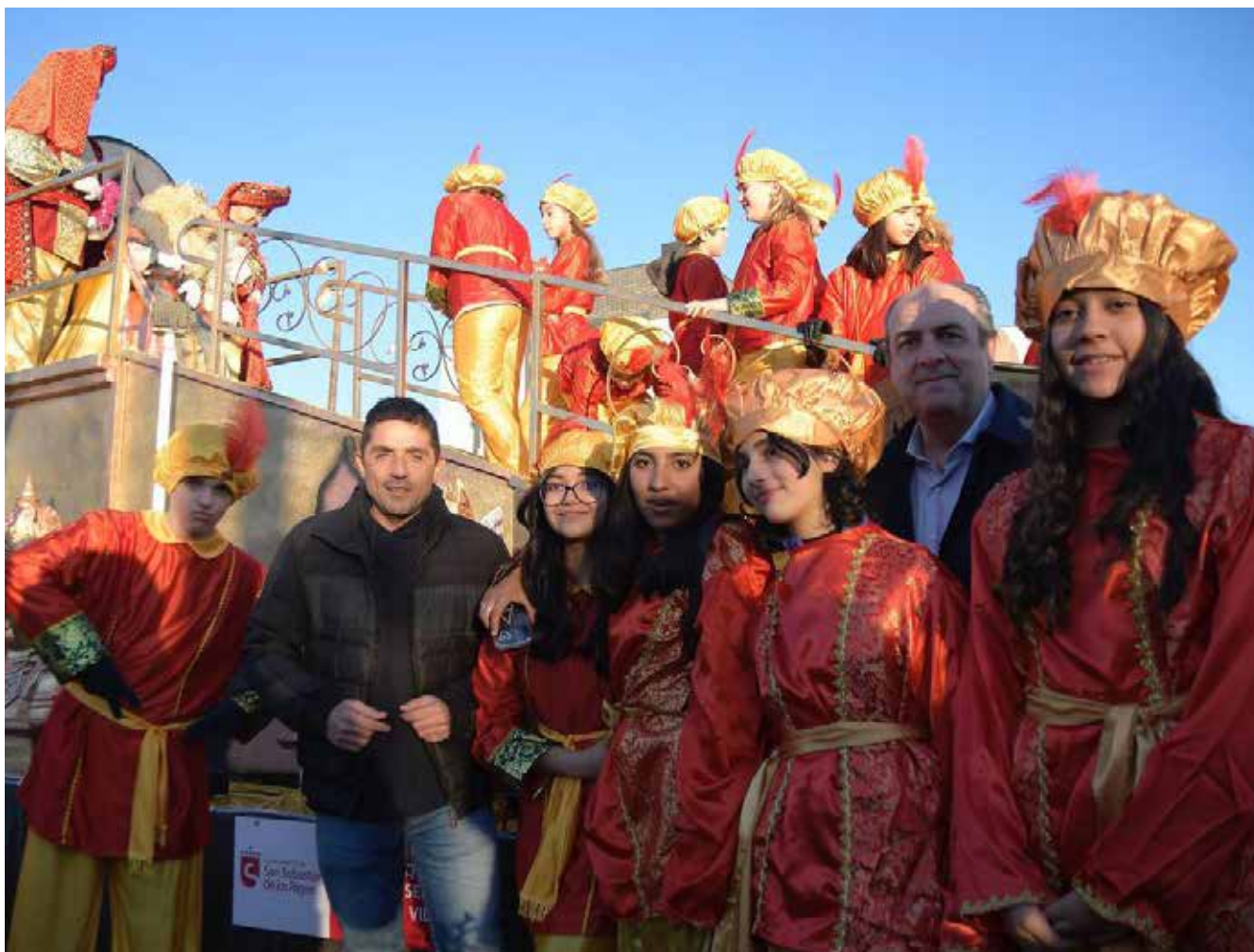
▲ La última cabalgata de Reyes se recordará por su colorido y gran participación de grandes y pequeños.