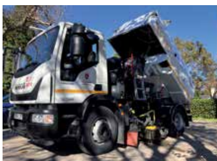
▲ Desde la concejalía se han realizado numerosas acciones optimizando los recursos para mejorar la limpieza.

realizado numerosas acciones optimizando los recursos para poder gestionar mejor la limpieza. La más importante fue activar un contrato especial de Limpieza para el barrio de Moscatelares, una zona que fue olvidada en 2015.