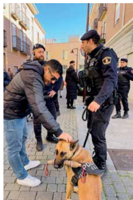
▲ Se ha creado la Unidad Canina de la Policía Local.

La Policía Local de San Sebastián de los Reyes ha dado un cambio radical en este mandato, con el aumento de la plantilla de 35 policías locales y la puesta en marcha del Plan de Modernización de 2 millones de euros. Se ha dado un paso fundamental en la estabilización de nuestro cuerpo de