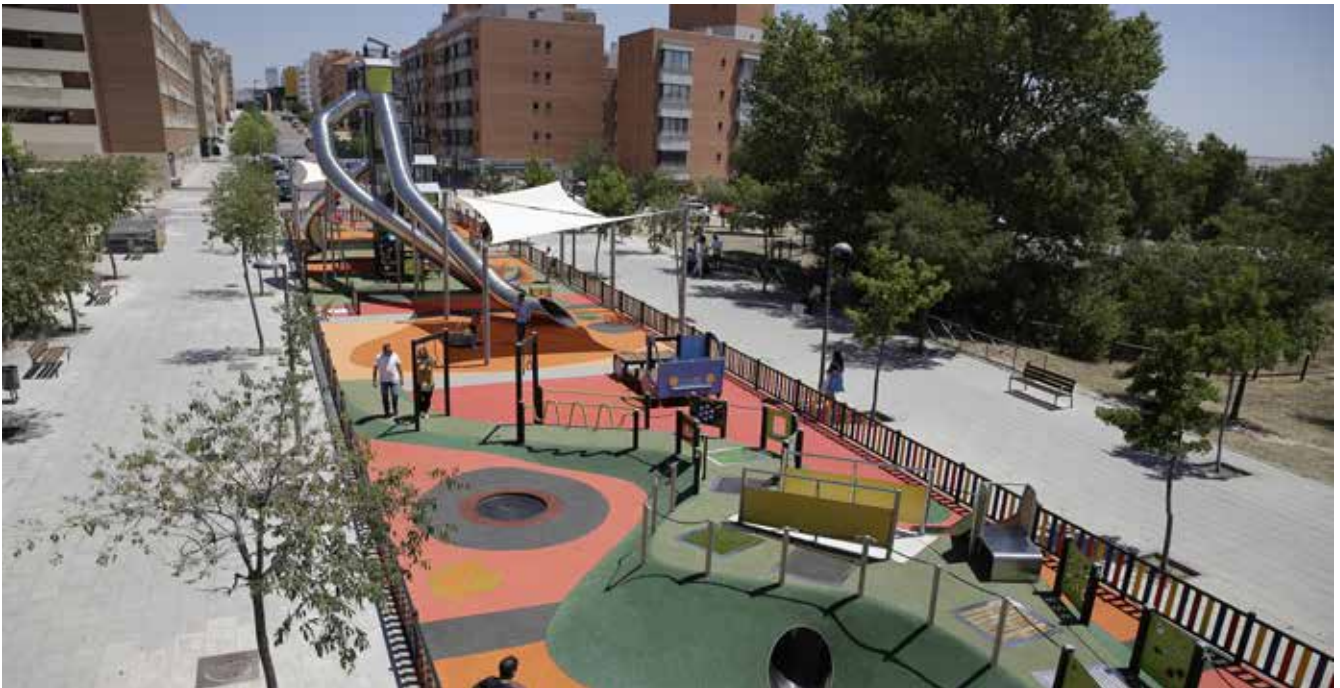
▲ El parque infantil inclusivo en el barrio de Dehesa Vieja ha tenido una gran aceptación entre los vecinos.

2,6 millones de euros en nuevos parques inclusivos y más áreas deportivas y caninas.