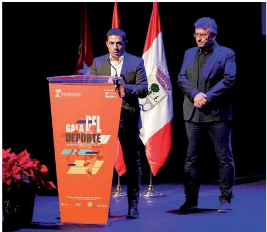
▲ El deporte es una de las apuestas más importantes del mandato.

Cada día hay más vecinos que me hacen la misma pregunta y me piden que no abandone el proyecto que he iniciado con mi equipo. Estos cuatro años son solo el comienzo del proyecto que quiero para el pueblo que me vio nacer. Vivo en Sanse, amo Sanse y siempre lucharé por Sanse. ■