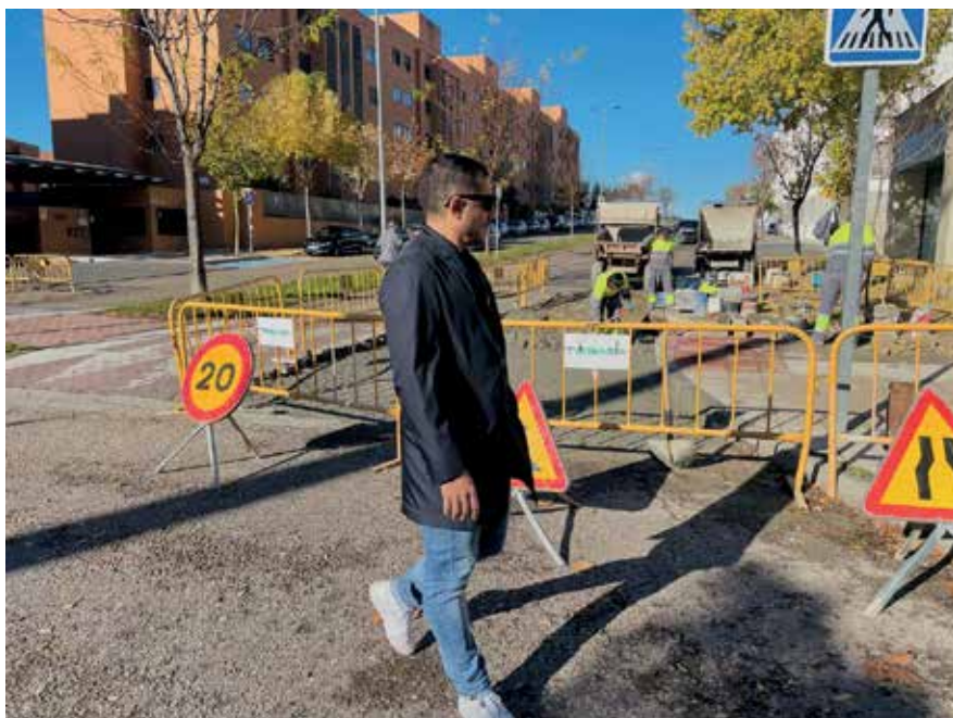
▲ Se han modificado más de 100 badenes en toda la ciudad.

Este mandato también ha supuesto la puesta en marcha de inversión del dinero de todos los vecinos en multitud de mejoras, algunas ya visibles, y otras que están en proyecto. Un gran número de obras, con inversiones de millones de euros enfocadas a nuevas infraestructuras, a la mejora de