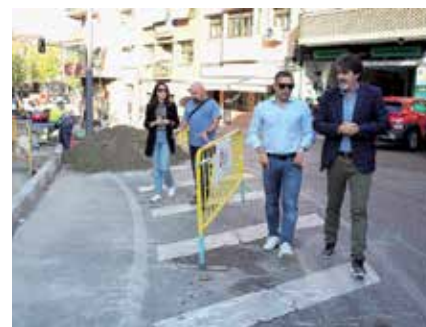
▲ Las obras de proximidad han mejorado distintos puntos del casco urbano.

El esfuerzo realizado en obras de mantenimiento y mejora de los centros escolares, más de 3 millones de euros, ha posibilitado que en este mandato se cambiaran todas las calderas de los colegios públicos.