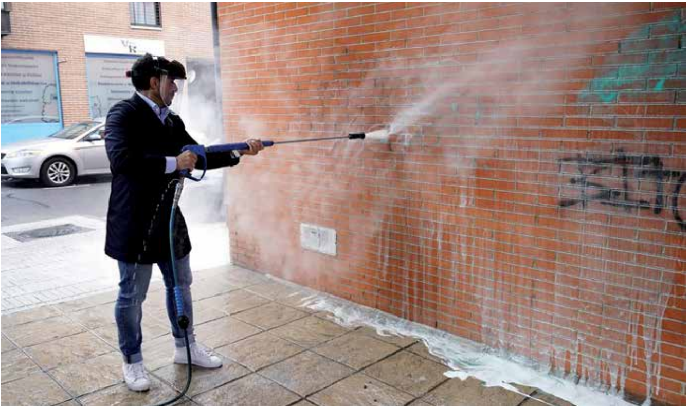
▲ Se han activado las Brigadas Antigrafiti para mejorar el entorno urbano.

Durante la pandemia fue un servicio fundamental y el servicio se adaptó para desinfectar calles, puntos de transporte público, farmacias y zonas de gran concentración de personas.