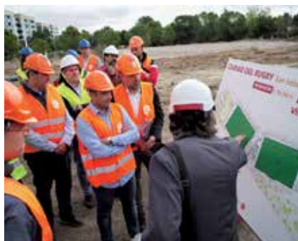
▲ Ha sido un mandato muy activo en Obras y Proyectos, como la Ciudad del Rugby.

La diferencia ha sido abismal. Sólo hay que ver y pisar la calle, se están haciendo muchas actuaciones visibles como las obras e invisibles como la gestión municipal en Recursos Humanos y en Economía y Hacienda. El trabajo que he hecho con todo mi equipo no es comparable con otros gobiernos. Re-