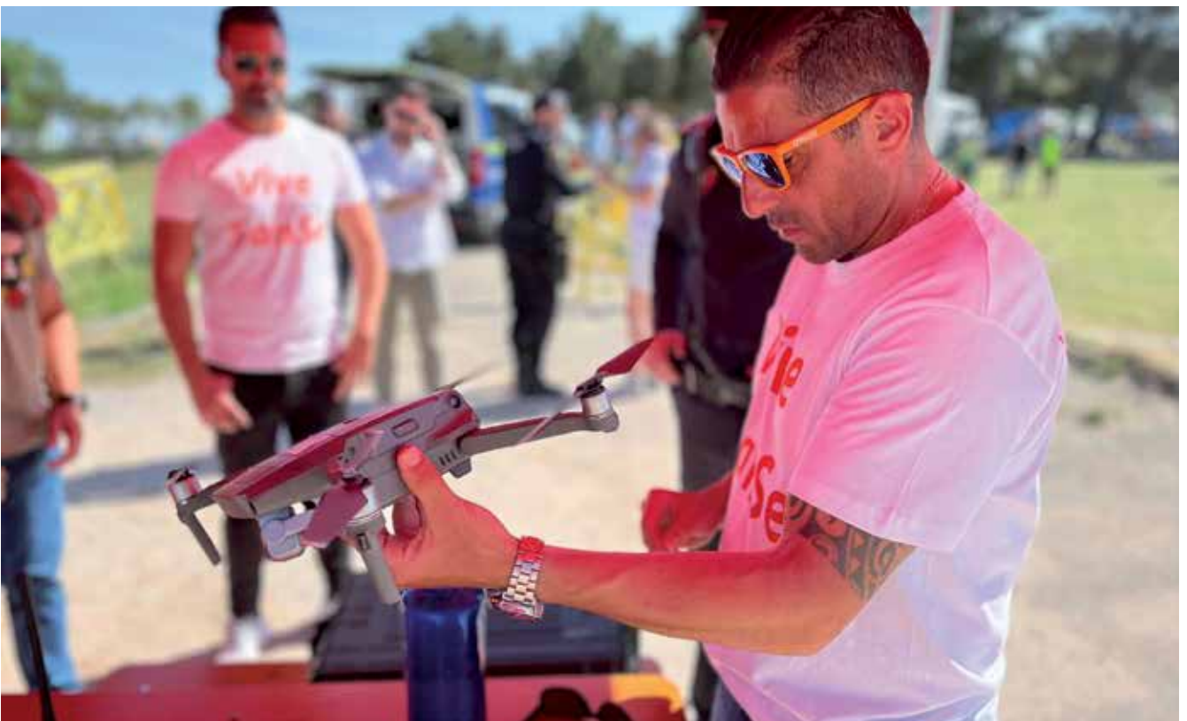
▲ Nuestra Policía Local cuenta ya con un dron, gracias a la creación del Servicio de Vigilancia Aérea.

se está trabajando en incorporar más videovigilancia en las calles y la puesta en marcha de más instrumentos de trabajo para nuestra Policía Local que llevaba muchos años sin ser atendida y dotada adecuadamente. ■