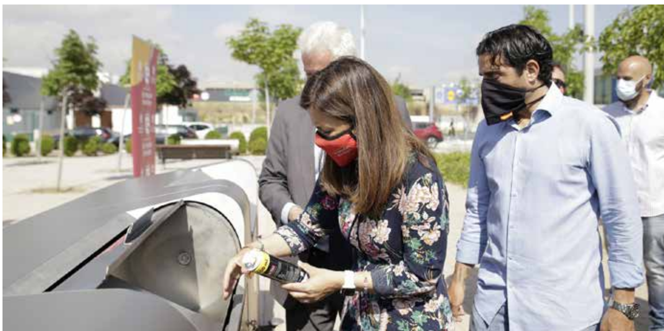
▲ Se han instalado 5 Puntos Limpios de Proximidad para acercar el reciclaje a los vecinos.

También los esfuerzos se han invertido en realizar limpiezas intensivas de calles, activar las brigadas antigrafitis y realizar la reposición de contenedores más importante de la historia de San Sebastián de los Reyes.