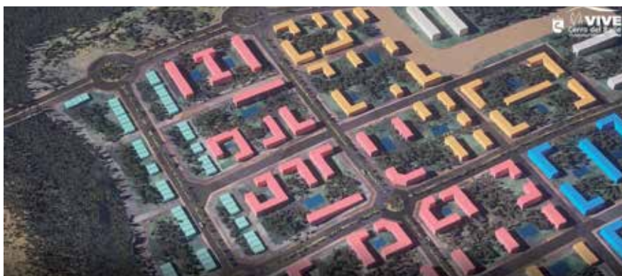
▲ Recreación del proyecto urbanístico Cerro del Baile.

Se prevé que próximamente se presenten los Proyectos de Reparcelación en el Ayuntamiento, para su tramitación. Con ellos está previsto que el 10% del aprovechamiento del ámbito, que legalmente corresponde al Ayuntamiento, se materialice en Vivienda de Protección Pública, concretamente en 1.058 viviendas. ■