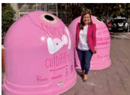
▲ Se han realizado multitud de campañas de concienciación de reciclaje.