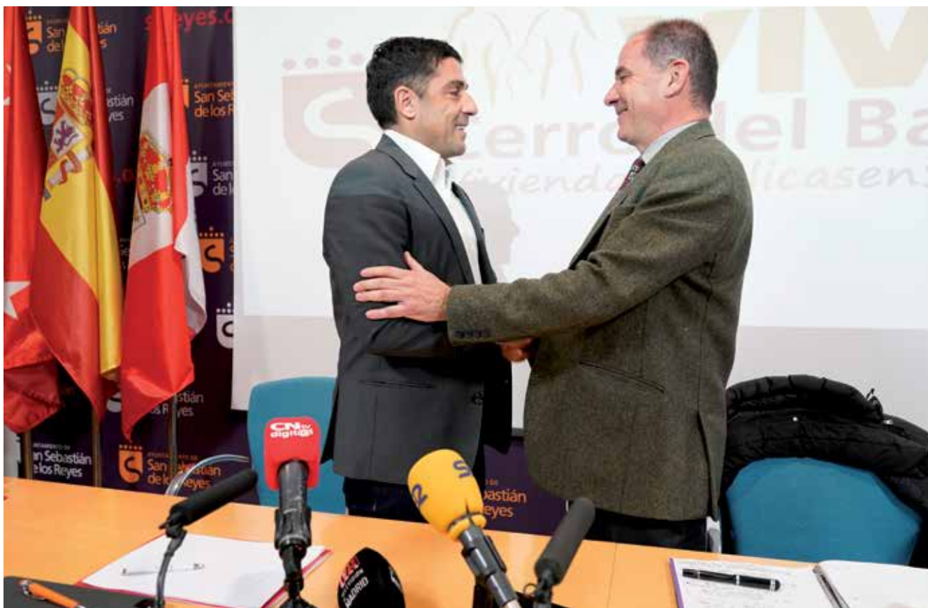
▲ El vicecalde anunció en rueda de prensa el proyecto de vivienda pública en Cerro del Baile.