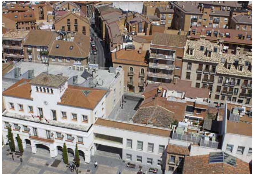
▲ El tiempo de pago a las empresas proveedoras de servicios se ha reducido desde 2019, otro dato que indica una buena gestión.