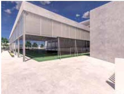
▲ Se inician las obras del Valvanera

En el apartado de obras están las importantes inversiones en Deporte, como los