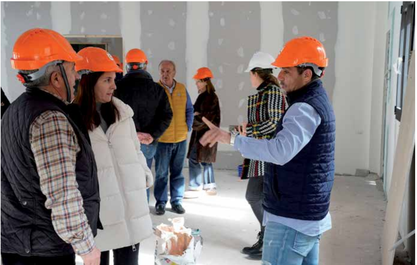
▲ Entre los proyectos de obras destaca la construcción del Centro Socio Cultural de Fuente del Fresno.

Entre las obras más reseñables están la reforma integral del centro de ocio de mayores en el casco histórico, el colector y peatonalización de la avenida de la Plaza de Toros y la adecuación de más de 100 badenes.