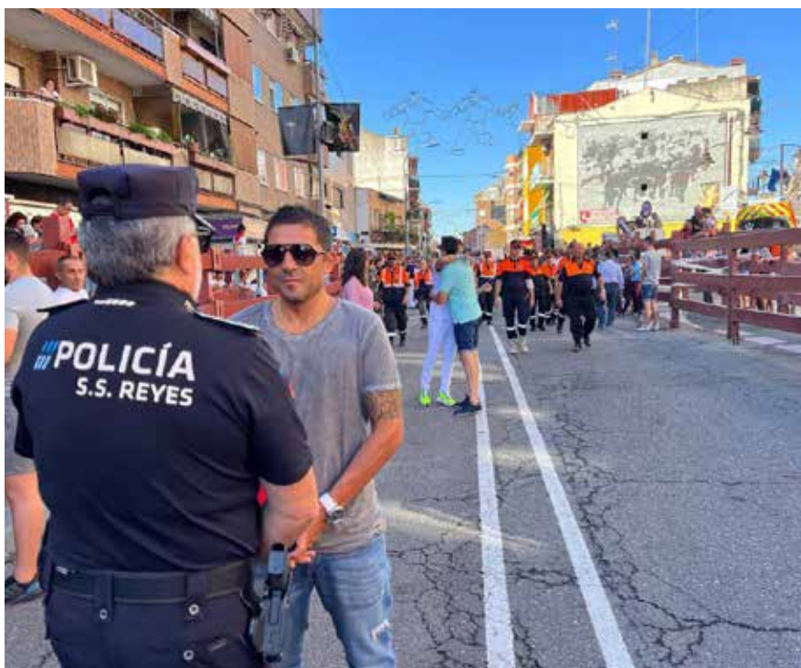
▲ La seguridad ciudadana ha sido una de las máximas apuestas de las fiestas.