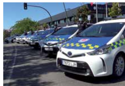
▲ Se ha renovado el 90% de la flota de la Policía Local