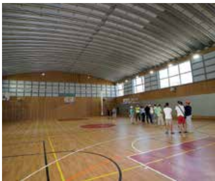
▲ Nuevo Pabellón del Buero Vallejo.

5,7 millones de euros de la emblemática Ciudad del Rugby, ya en marcha, las próximas renovaciones de las instalaciones del Valvanera y del López Mateo y numerosas acciones en la mejora de las infraestructuras deportivas escolares.