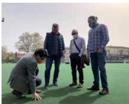
▲ Se han llevado a cabo grandes inversiones en infraestructuras deportivas.

La apuesta por el Deporte en el municipio se ha materializado en multitud de inversiones y proyectos, al igual que por los clubes deportivos y la práctica deportiva orientada a la salud. Además de todos los programas puestos en marcha desde la Concejalía de Deportes por los que han pasado miles y miles de vecinos en los Campus de Verano, en los programas escolares, etc., en este mandato 2019 – 2023 hay que destacar la gestión para sacar adelante proyectos e inversiones por valor de más de 42 millones.