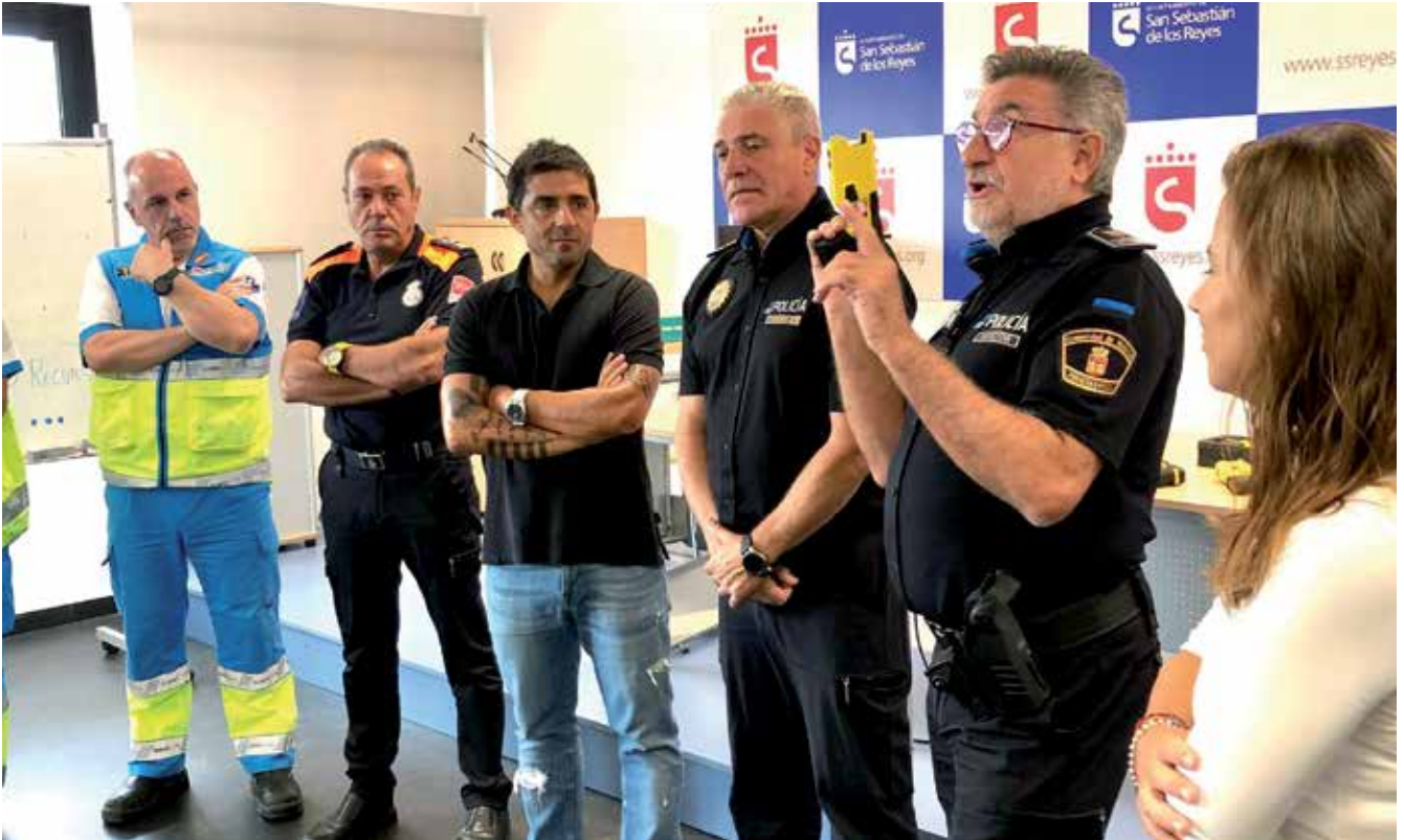
▲ Gran apuesta por la seguridad de los agentes y de la ciudadanía con la adquisición de dispositivos Taser.

se ha creado y formalizado la Unidad Canina, la puesta en marcha de la Servicio de Vigilancia Aérea con el dron, la incorporación de los dispositivos taser y la creación del Grupo Operativo y Seguimientos de la Policía Local. Ade-