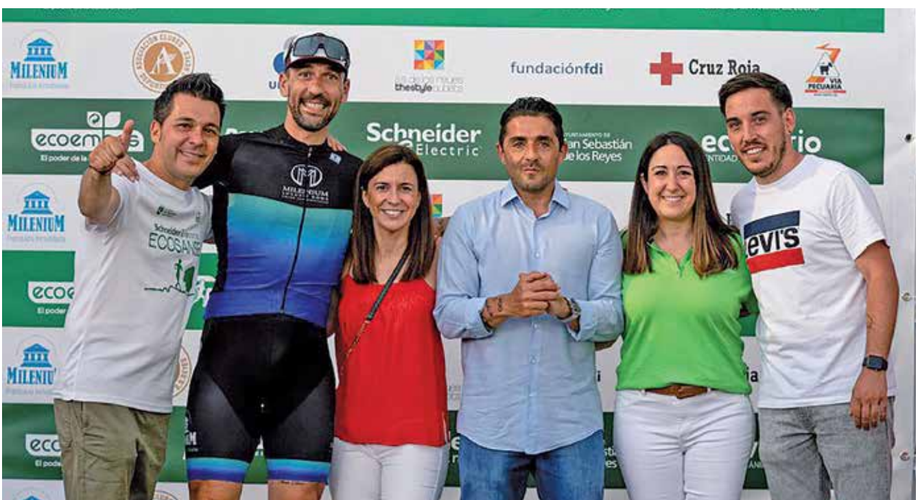
▲ La ciudad celebró la 1ª Carrera por el Medio Ambiente, con gran participación.

En materia de medioambiente, las acciones se han dirigido a hacer accesible el Aula de Naturaleza, a realizar numerosas acciones ambientales, recogidas de residuos y plantaciones de árboles en la naturaleza, más de 30 y con una participación de 4.000 personas, con escolares, vecinos y entidades públicas y privadas. ■