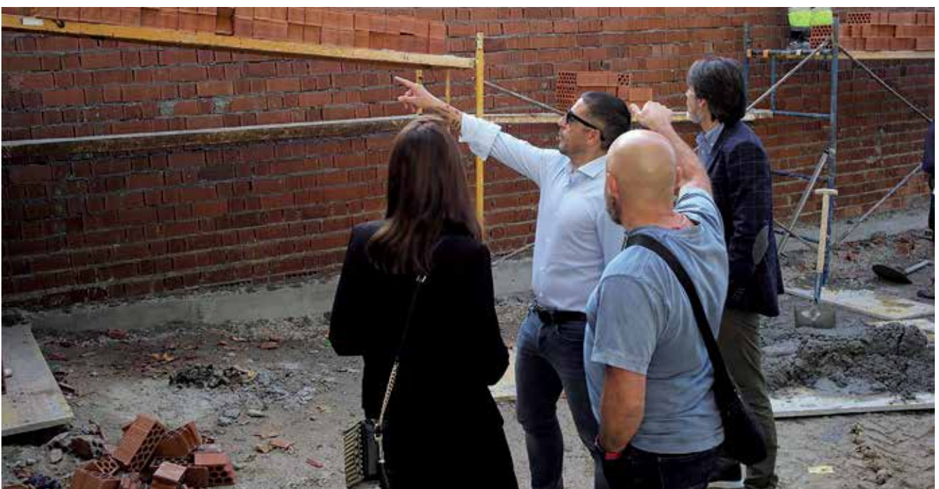
▲ Destaca la remodelación de las escaleras de la calle Virtudes con avenida de la Sierra para mejorar la accesibilidad.

la Zona de Bajas Emisiones. La apuesta por la mejora de las infraestructuras con un nuevo contrato de obras y servicios a la medida del municipio ha hecho posible que se dé un paso adelante muy importante en obras que repercuten en la movilidad de las personas y de los vehículos en San Sebastián de los Reyes. ■