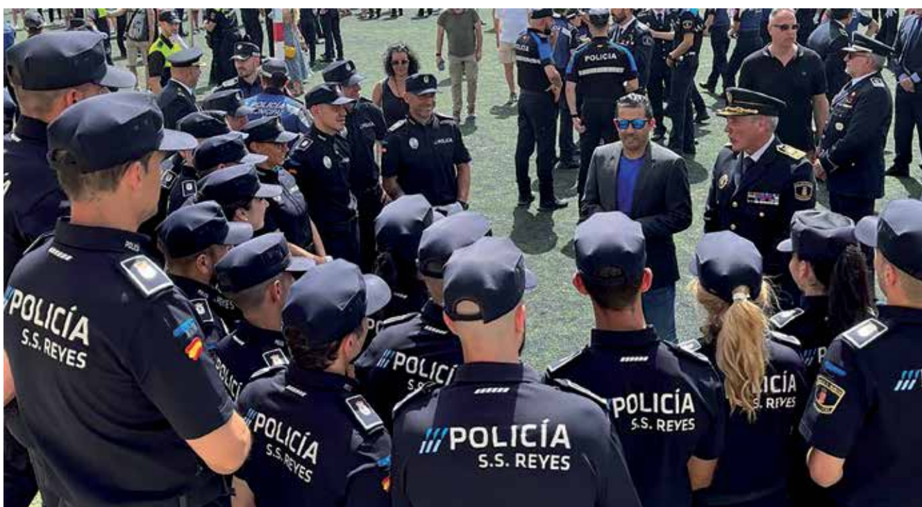
▲ Uno de los hitos de este mandato ha sido la incorporación de 35 policías locales.

En este mandato 2019 – 2023 se ha renovado el 90% de la flota de vehículos, una nueva furgoneta de atestados,