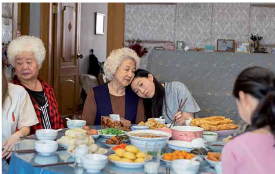
▲ Cine de Autoras con "The Farewell", de la directora Lulu Wang, el martes 7 de marzo, en el Centro Joven.

Parque de los Arroyos, al comienzo de la avda. de Portugal. ■